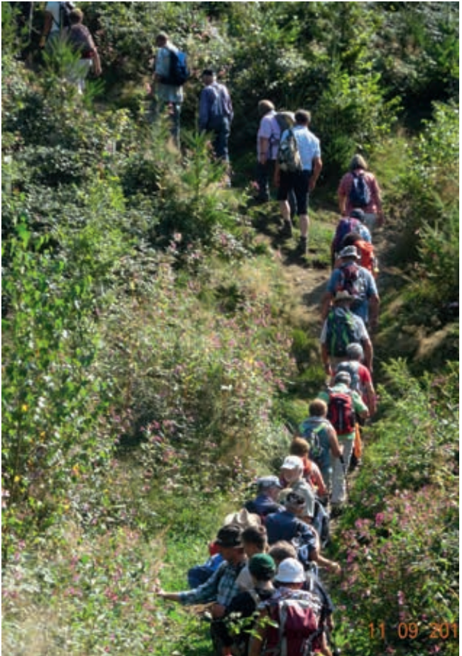
„Wandern mit Freunden“ auf dem HW4 zwischen Vogt und Bodnegg.